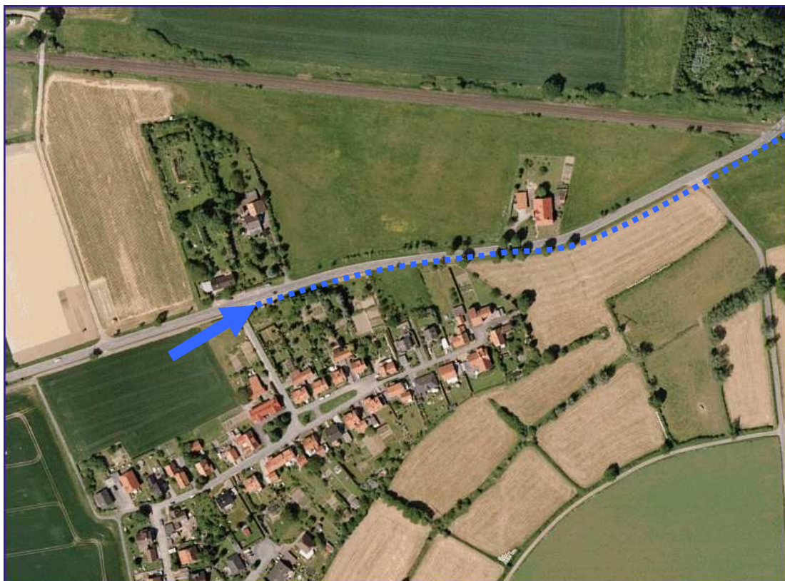
Bild 2: ... bis zur Neelhofsiedlung.